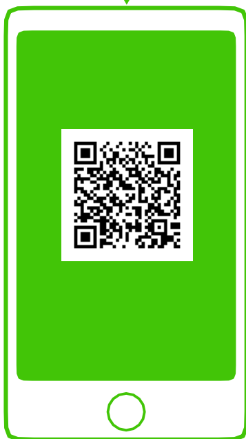
※新型コロナウイルス対策パーソナルサポート（行取） QRコードから登録